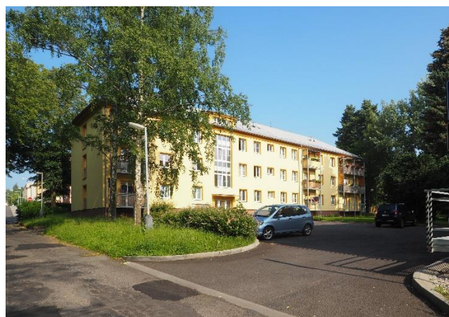
DŮM S PEČOVATELSKOU SLUŽBOU