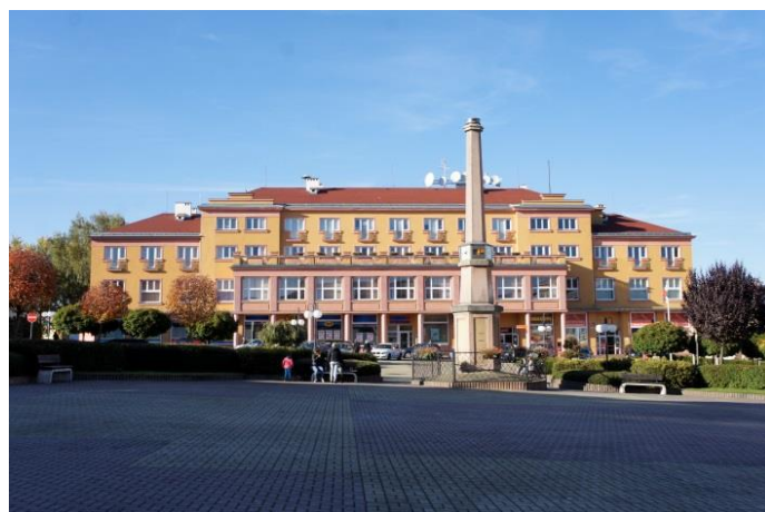
NOVÉ NÁMĚSTÍ – URBANISTICKY KVALITNÍ ZÁSTAVBA - 50. léta minulého století