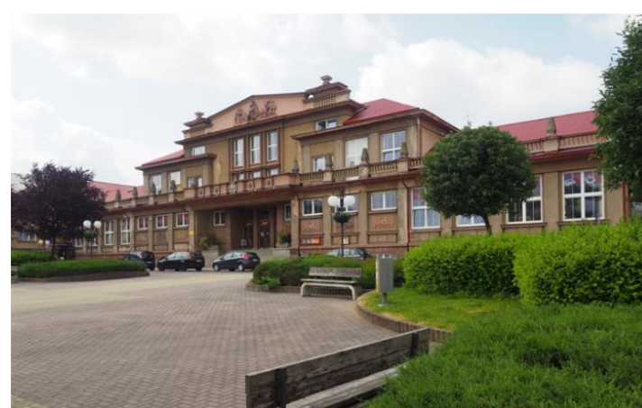
MĚSTSKÉ KULTURNÍ STŘEDISKO