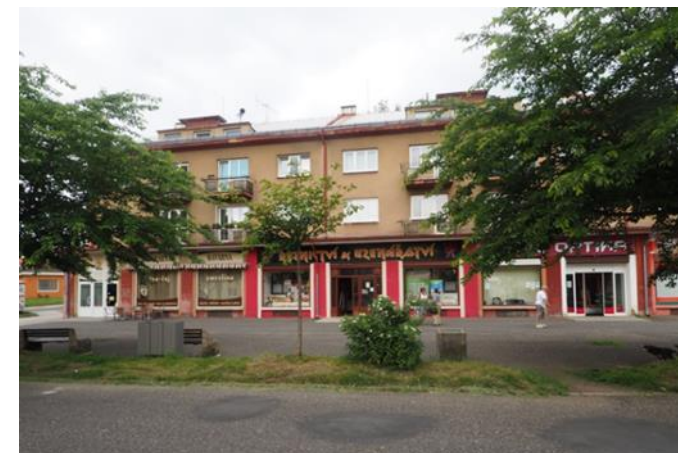
DROBNÉ PROVOZOVNY OBČANSKÉ VYBAVENOSTI