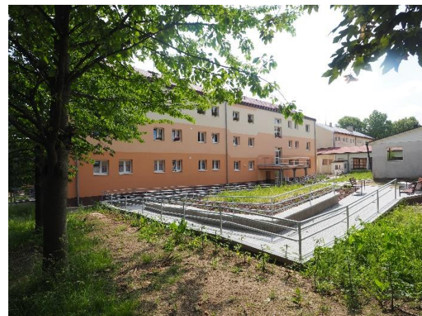
KOMUNITNÍ DŮM SENIORŮ