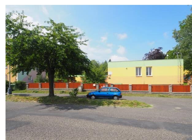
MATEŘSKÁ ŠKOLA SPORTOVNÍ