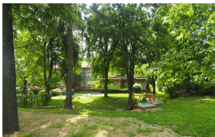
DOSTUPNOST OBČANSKÉ VYBAVENOSTI - MATEŘSKÁ ŠKOLA DLOUHÁ