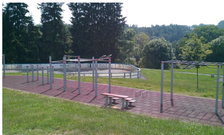
SKATEPARK, VENKOVNÍ POSILOVNA, KLUZIŠTĚ, DĚTSKÉ HŘIŠTĚ V DOSAHU