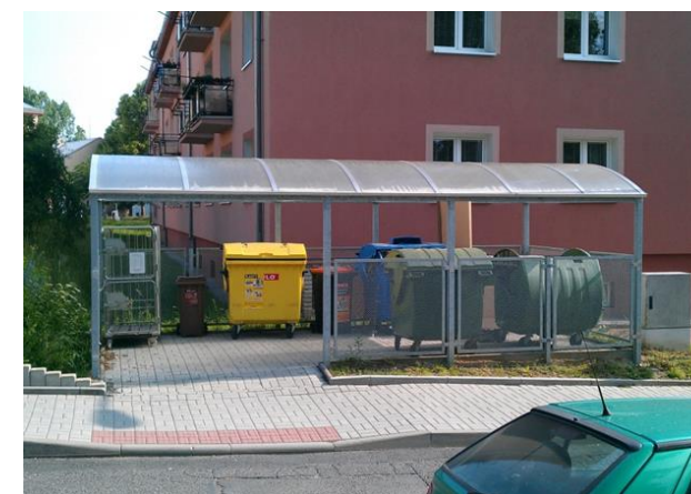
NOVÉ PŘÍSTŘEŠKY PRO POPELNICE