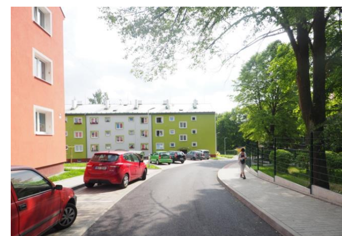
POSTUPNÉ ZMĚNY V SÍDLIŠTI K LEPŠÍMU - STAVEBNÍ ÚPRAVY DLOUHÉ ULICE